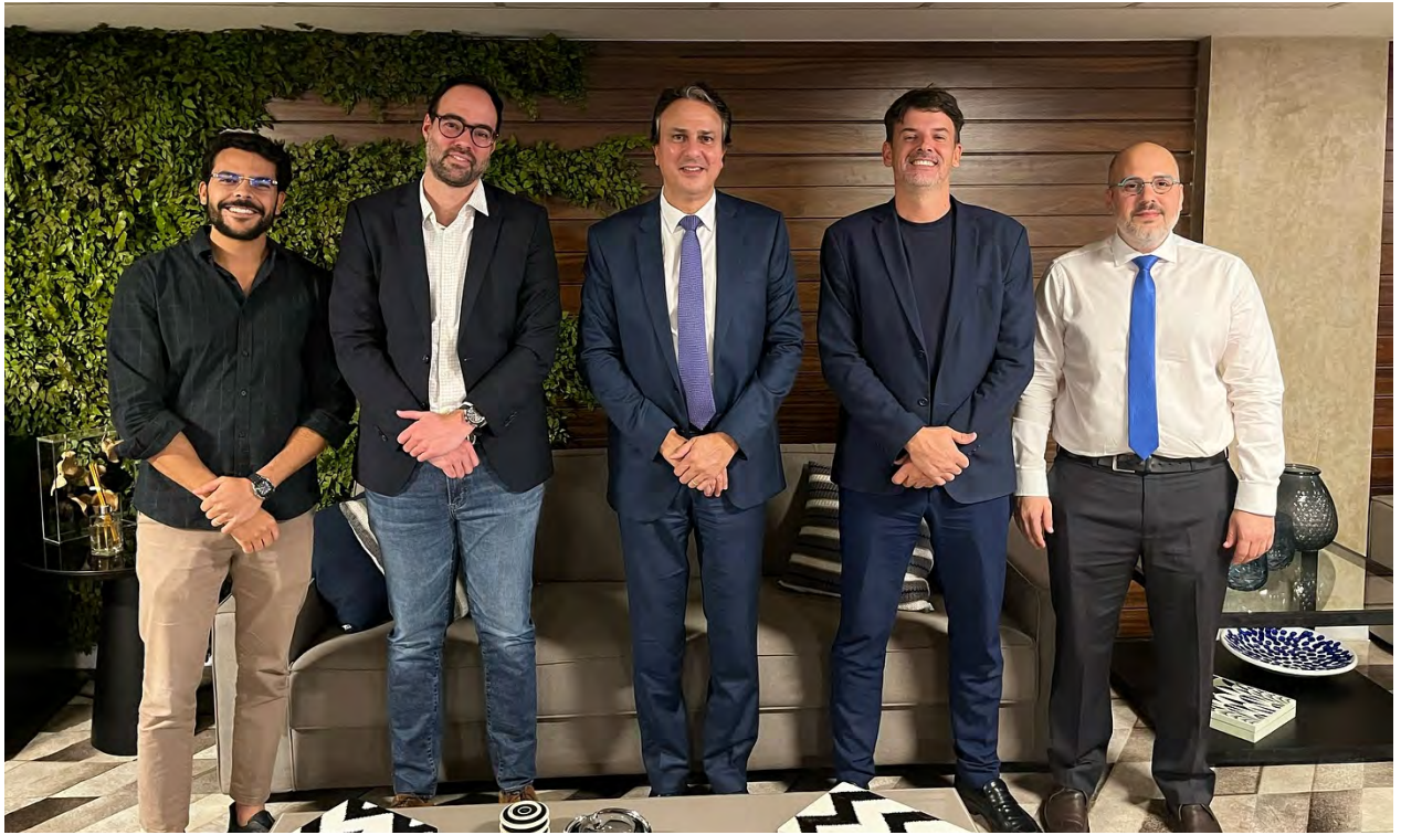
A Abrattel e a RECORD Brasília receberam, na quarta-feira (4), o ministro da Educação, Camilo Santana.